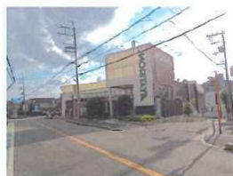
(モリタ屋南平台店)

備考 周辺施設 モリタ屋南平台店まで530m 高槻市立南平台小学校まで750m 高槻市立阿武野中学校まで560m